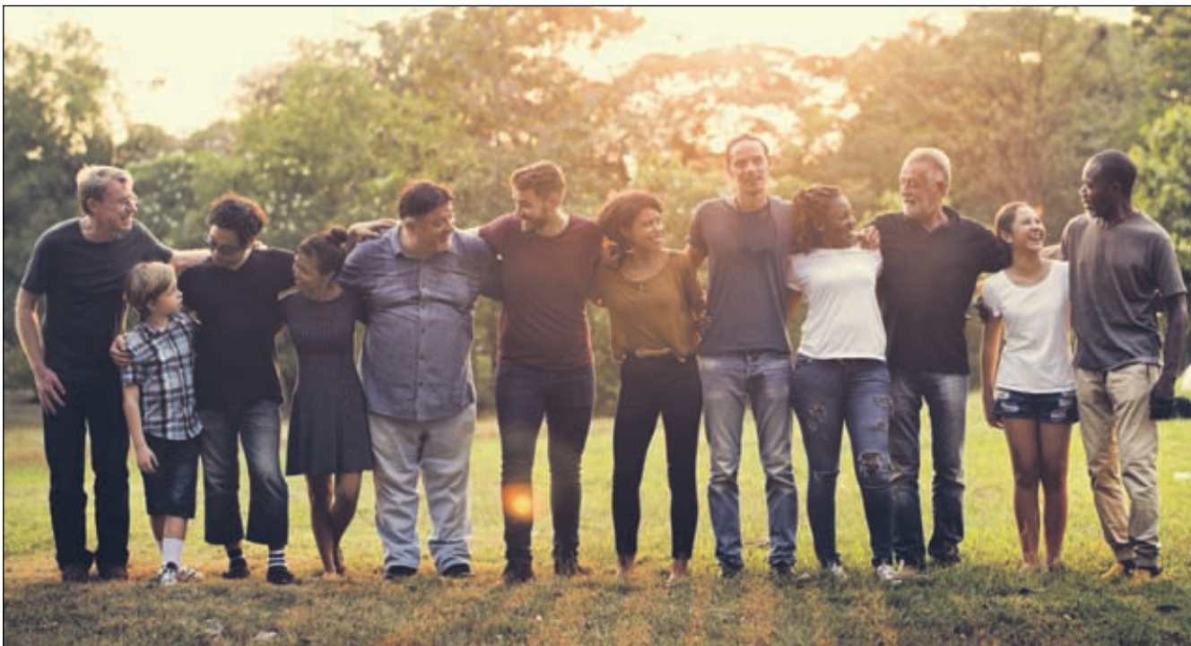
Som kristne er vi kaldet til enhed og inbyrdes kærlighed på tværs af generationer, etnicitet og kirkeretninger. Paulus taler, underviser og skriver mere om enhed, end han eksempelvis skriver om retfærdiggørelse, som han på mange måder er blevet mere kendt for.

På Det Nye Testaments tid var den helt store enhedsudfordring mellem jøder og hedninger. Det burde være en umulig opgave at bevare enheden, fordi teologiske, historiske, sociale og kulturelle faktorer konstant udfordrede enheden blandt disse grupper.