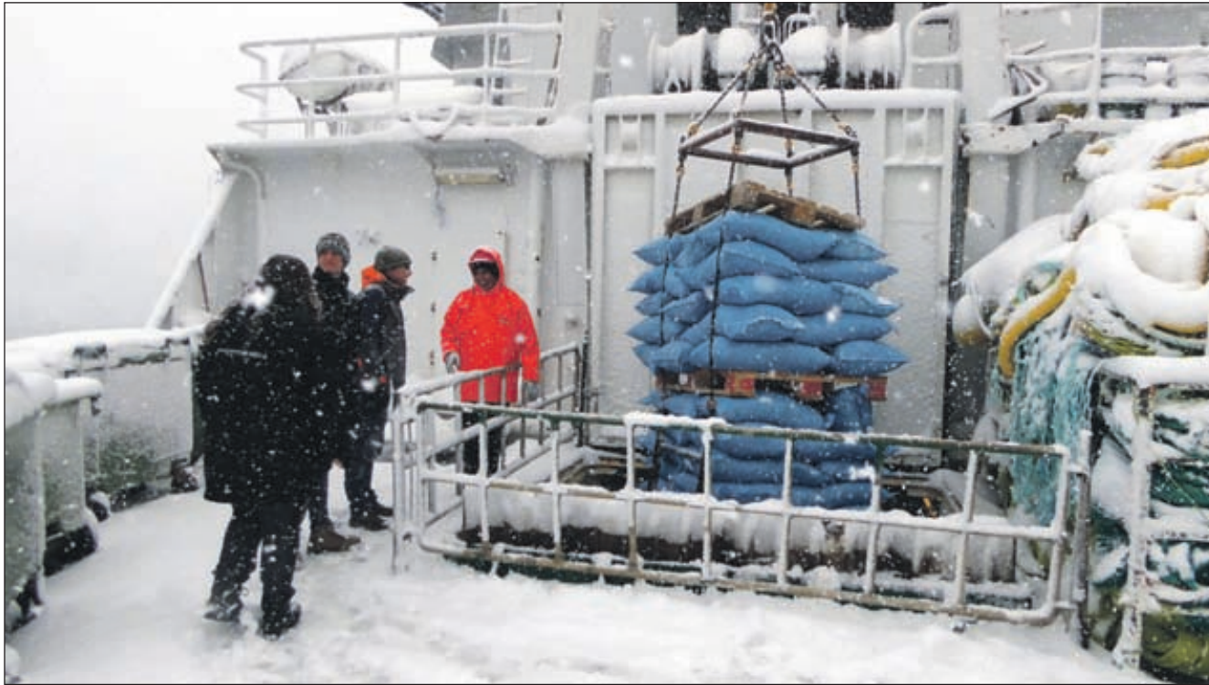
Skibsbesøg bliver en del af Simons arbejde på Grønland.