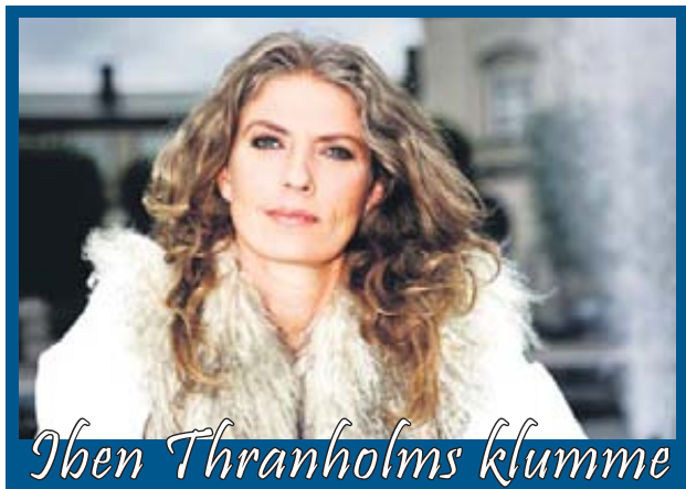
Iben Thranholms klumme