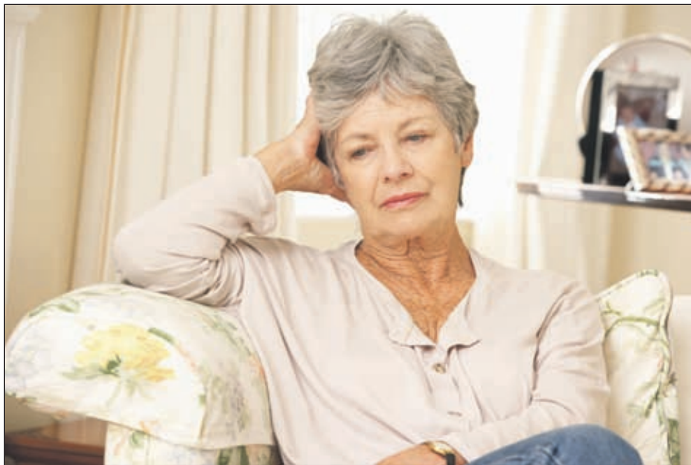
Jeg bliver ved med at føle mig som en stor synder. Der er vist ikke noget af det, som jeg gør, som bliver gjort af et rent hjerte.

Jeg mener, at jeg forsøger den verdens væsen og tillokkelser. Jeg anstrenger mig meget. Jeg