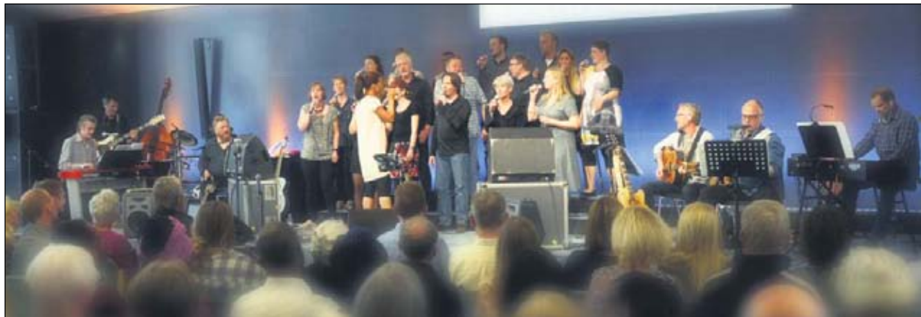
Gospelkoret WORSHIP er inspireret af amerikansk country/gospel tradition, ikke mindst Gaither Gospel.