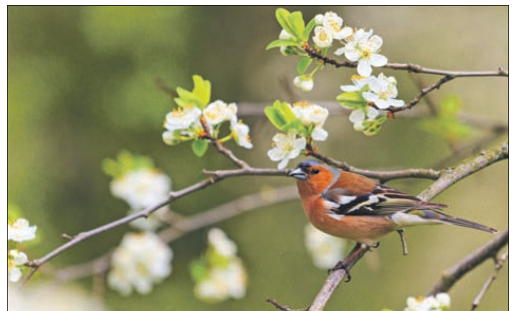
Du skal se på fuglene og på blomsterne. Blomsterne anstrenger sig ikke for at vokse, de bekymrer sig ikke for at få den rette form og farve.

Det onde og dine fejl og mangler er ikke det vigtigste her i